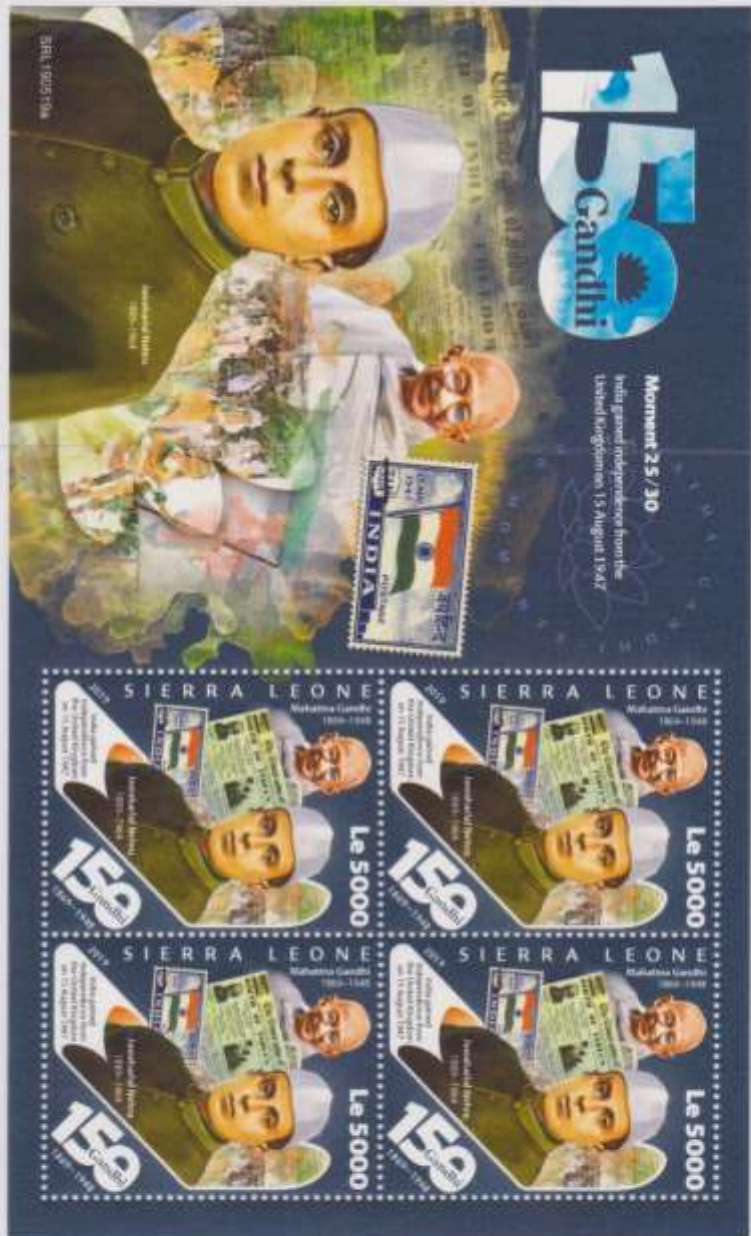
1947-India n° 2 € 1,20 SOS-2019-Sierra Leone Y&T n° M. Gandhi