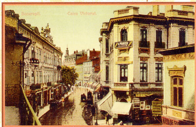
O perspectivă a Căii Victoriei, după ploaie, în vara anului 1910.