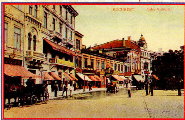
Pe Calea Victoriei, la-nceput de veac, în dreptul Terasei Oteteleşanu, lângă Teatrul Național.