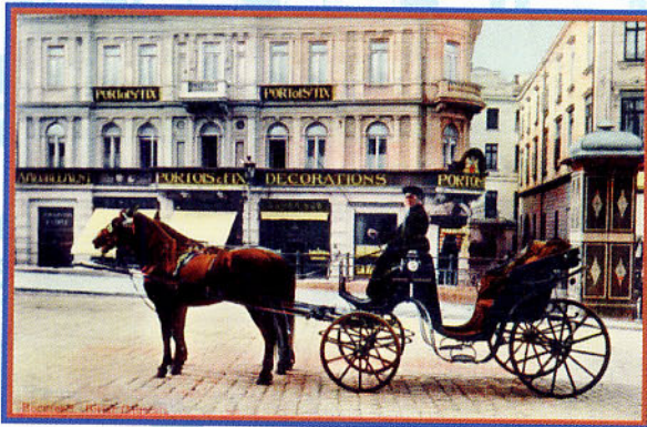
Muscalul, pe capra birjei, adăstându-și mușterii peste drum de "Bereria Cooperativă Gambrinus"