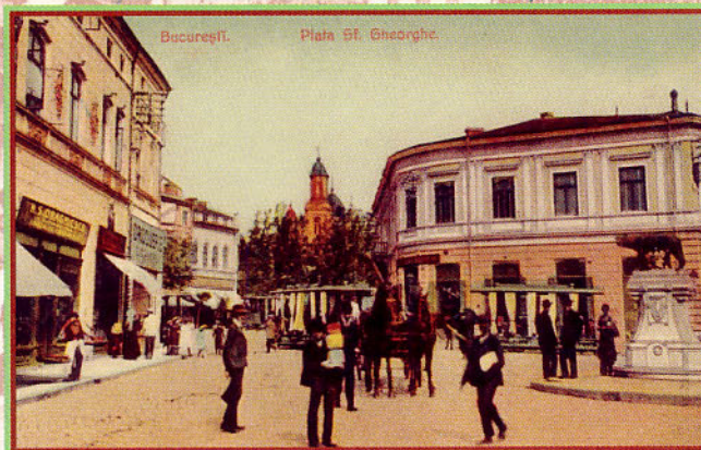
În piața Sfântu' Gheorghe, la început de secol, Lupoaița Romei privea de sus birjele și tramvaiele cu cai.