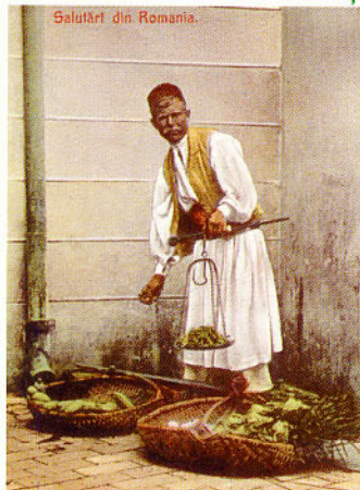
Olteanul cu cobilița, adevărat "aprozar" ambulant, vindea bucureștenilor legume și fructe de tot felul, în plină stradă.