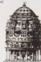
Estúdio de Arquitectura de Sergey Tkachenko